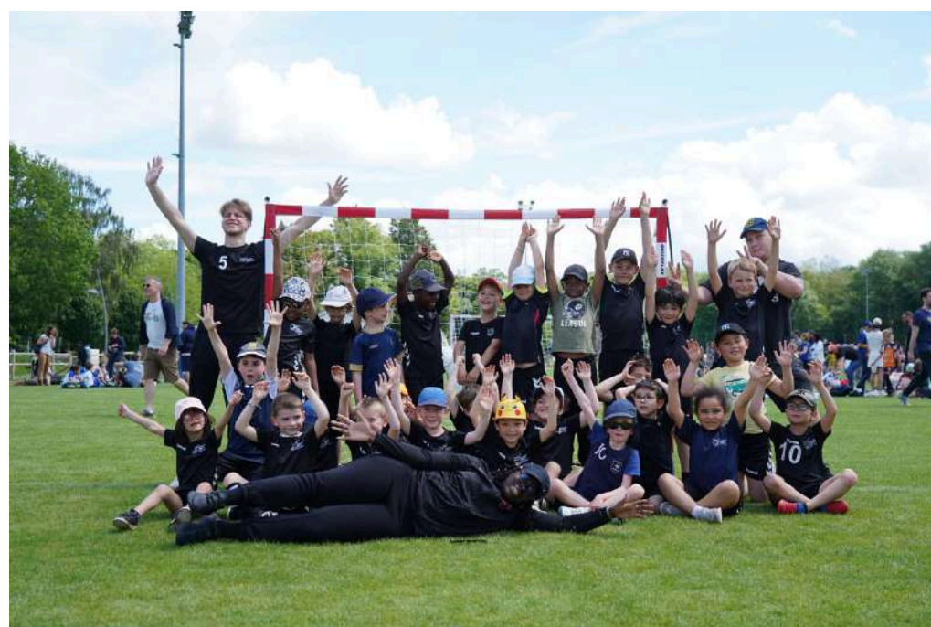
Tournoi sur herbe Ecole du Hand

Pour ses collectifs de BabyHand et d' Ecole du Hand L'ASF Handball accueille chaque samedi une soixantaine d'enfants qui viennent développer leur motricité, leur esprit d'équipe et la notion de partage.