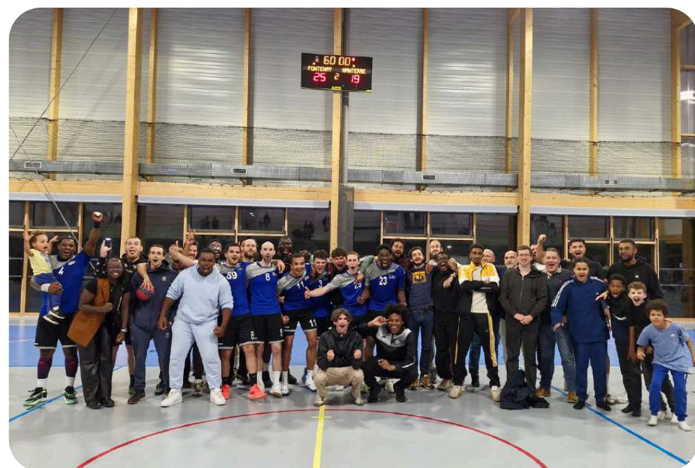
Victoire qualificative de nos +16M1 pour la Région

Pour son collectif de +16M1 , Qui va évoluer en championnat Région Honneur dès la saison 24/25. Avec un collectif soudé et motivé, nos seniors 1 ont su atteindre leur objectif et la région !